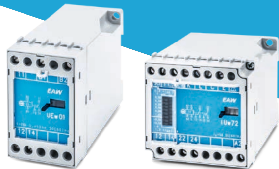
Messende Relais von eaw sorgen in Systemen der Steuerungs- und Regeltechnik für eine zuverlässige Überwachung etwa von Netzen und Industrieanlagen.