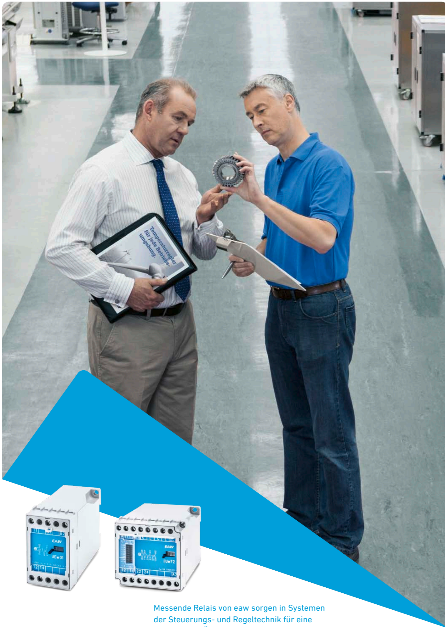
Messende Relais von eaw sorgen in Systemen der Steuerungs- und Regeltechnik für eine zuverlässige Überwachung etwa von Netzen und Industrieanlagen.